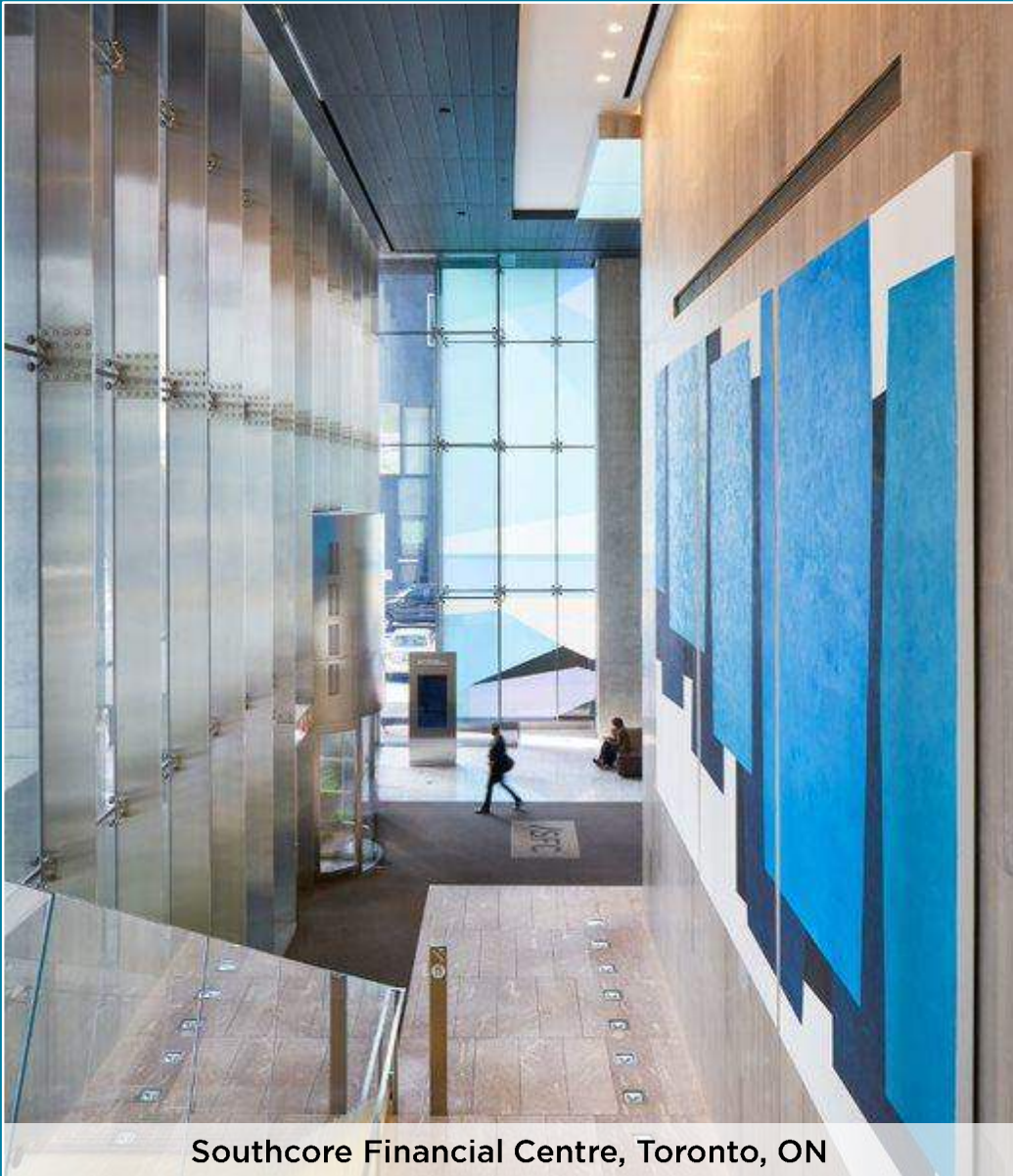
Southcore Financial Centre, Toronto, ON