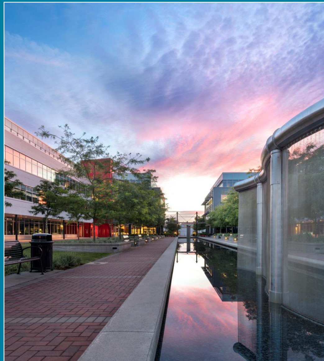
Broadway Tech, Vancouver, BC

D'ici 2050, QuadReal vise à réduire son empreinte carbone de 80 % par rapport aux niveaux de 2007.