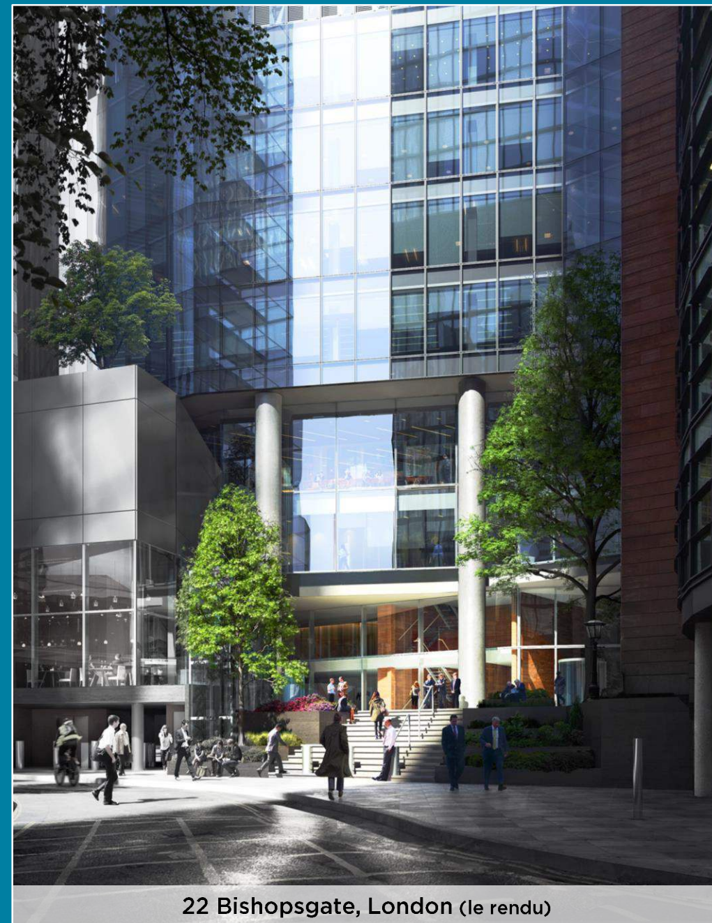
22 Bishopsgate, London (le rendu)

Ce document peut contenir des déclarations prospectives au sens de la législation en valeurs mobilières applicable. Ces déclarations reflètent le point de vue actuel de QuadReal Property Group (« QuadReal »), et sont fondées sur les renseignements disponibles au moment de la publication. Ces déclarations ne sont pas des garanties de performance future, et reposent sur des estimations et des hypothèses assujetties à un certain degré de risque et d'incertitude. Les résultats réels et les événements futurs dépendent de plusieurs facteurs, et pourraient ainsi différer considérablement des déclarations prospectives. Par conséquent, le lecteur ne doit pas s'y fier indûment. Toutes les déclarations prospectives comprises aux présentes sont visées par la mise en garde susmentionnée. Les déclarations prospectives ne sont valables qu'à la date de leur publication, et nous ne reconnaissons aucune responsabilité ou obligation de les mettre à jour ou de les réviser à la lumière de nouveaux renseignements, ou de circonstances ou d'événements futurs, à l'exception de ce qui est exigé en vertu des lois sur les valeurs mobilières applicables.